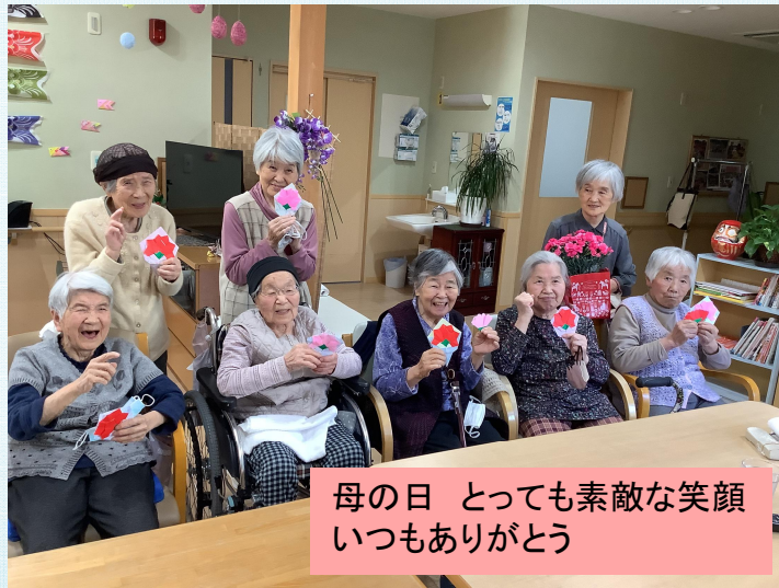
母の日 とっても素敵な笑顔 いつもありがとう