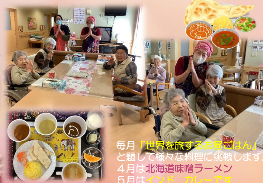
毎月「世界を旅するお昼ごはん」として様々な料理に挑戦します。 4月は北海道味噌ラーメン 5月はインド カレーです