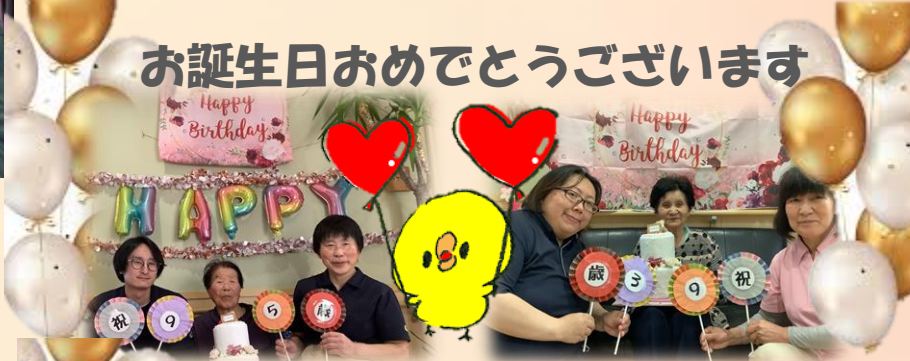
お誕生日おめでとうございます