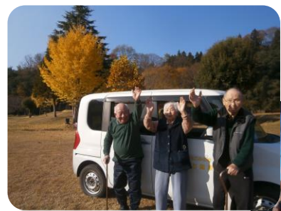
紅葉見学ドライブ