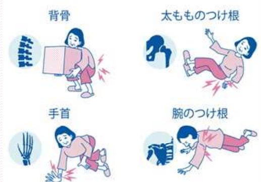
骨が弱るとささいな事で骨折に・・・

当院では、最も信頼性の高い二重エックス線吸収法を用いた検査装置で腰椎と大腿骨の2部位を測定し、骨量の減少を早期に発見することで、骨粗鬆症の適切な予防や治療に努めています。